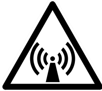
Símbolo ou pictograma