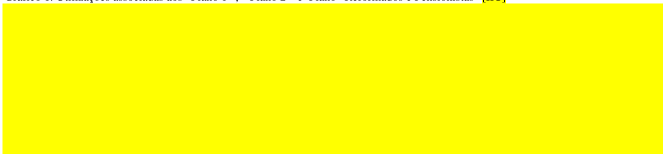
Gráfico 1. Utilizações associadas aos “Plano 1”, “Plano 2” e Plano “Reformados e Pensionistas” [IIC]